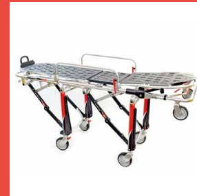
26-B Heavy Load