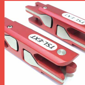
TSL Expander Kit