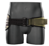
MILITARI VERDE OLIVA/NERO